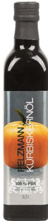
Abbildung 21: Pelzmann Steirisches Kürbiskernöl (Nr. 0016)