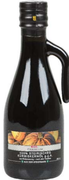
Abbildung 13: Spar 100% Steirisches Kürbiskernöl g.g.A. (Nr. 0008)