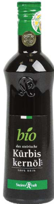
Abbildung 25: Weinhandl Mühle Steirisches Kürbiskernöl g.g.A. (Nr. 0020)