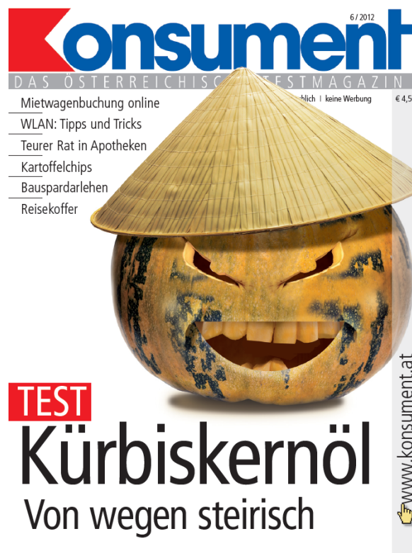
Abbildung 1: KONSUMENT Cover 6/2012 2

2012 arbeiteten wir zur Bestimmung der Herkunft mit der Universität Leoben zusammen. Diese hatte im Rahmen eines FFG-Forschungsprojektes ein Modell zur Herkunftsanalyse durch die Bestimmung der Elementspuren inklusive Seltener Erden entwickelt. Damit konnten sie die Herkunftsländer Österreich, Russland und China unterscheiden. Das heißt Kürbiskernöl beziehungsweise Mischungen aus diesen drei Gebieten lassen sich analytisch ganz gut eingrenzen. Für alle anderen möglichen Herkunftsländer funktioniert dieses Modell jedoch nicht.