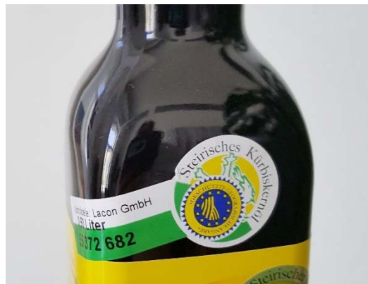
Abbildung 3: Banderole

Auf der Website des Vereines sind viele Infos zum steirischen Kürbiskernöl zu finden, unter anderem auch eine Darstellung der geographischen Gebiete 9 in denen die Kürbisse angepflanzt werden dürfen.