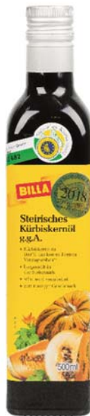
Abbildung 7: Ja! Natürlich Kürbiskernöl (Nr. 0002)