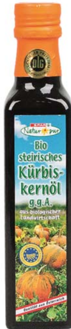
Abbildung 15: Dennree Steirisches Kürbis Kernöl g.g.A. (Nr. 0010)