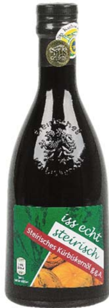
Abbildung 11: Kerngold Kürbis Kernöl (Nr. 0006)