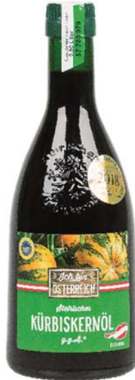
Abbildung 17: Fandler Original Steirisches Bio-Kürbiskernöl (Nr. 0012)