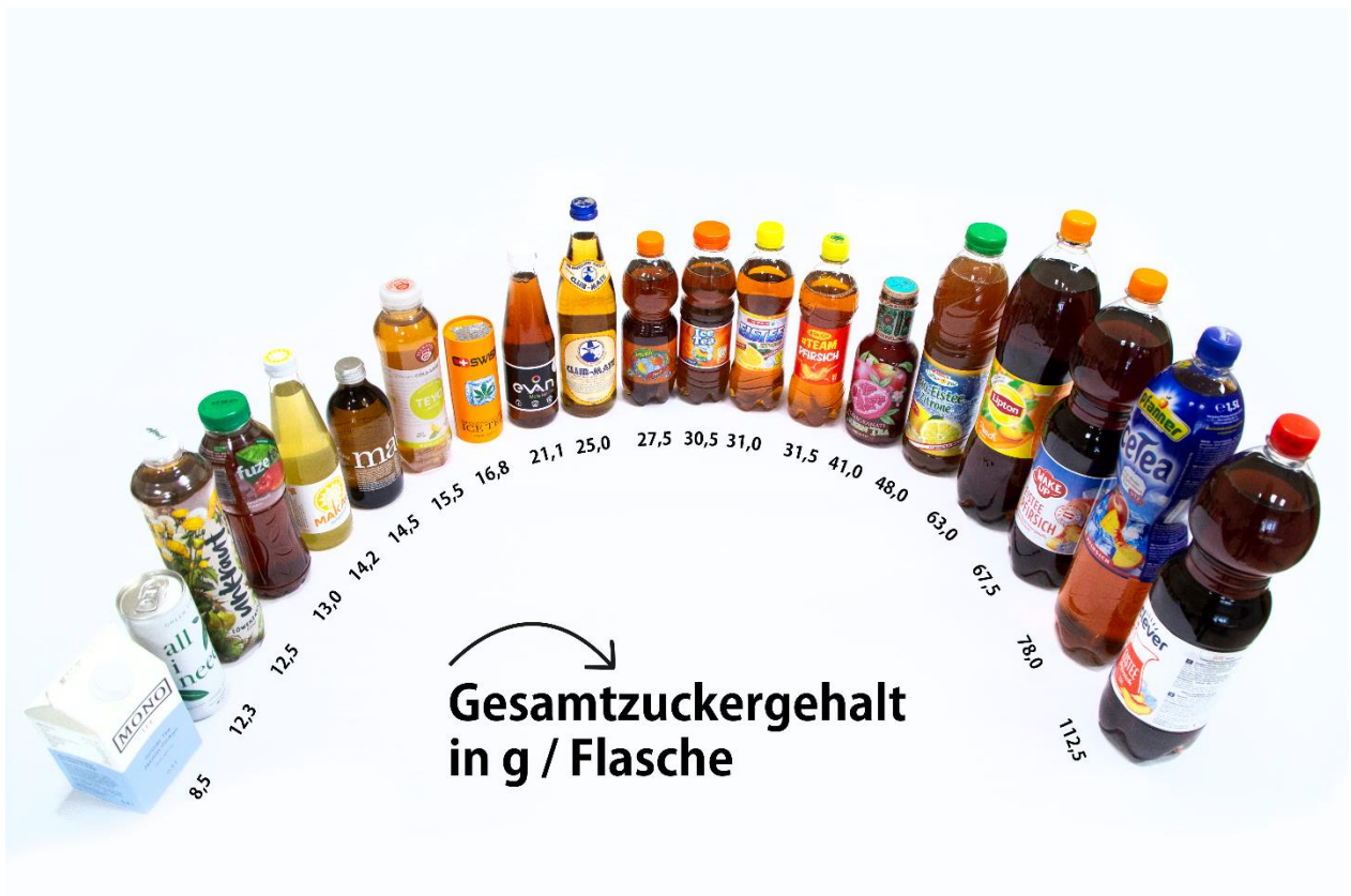
Abbildung 6: Gesamtzuckergerhalt in Gramm pro Flasche