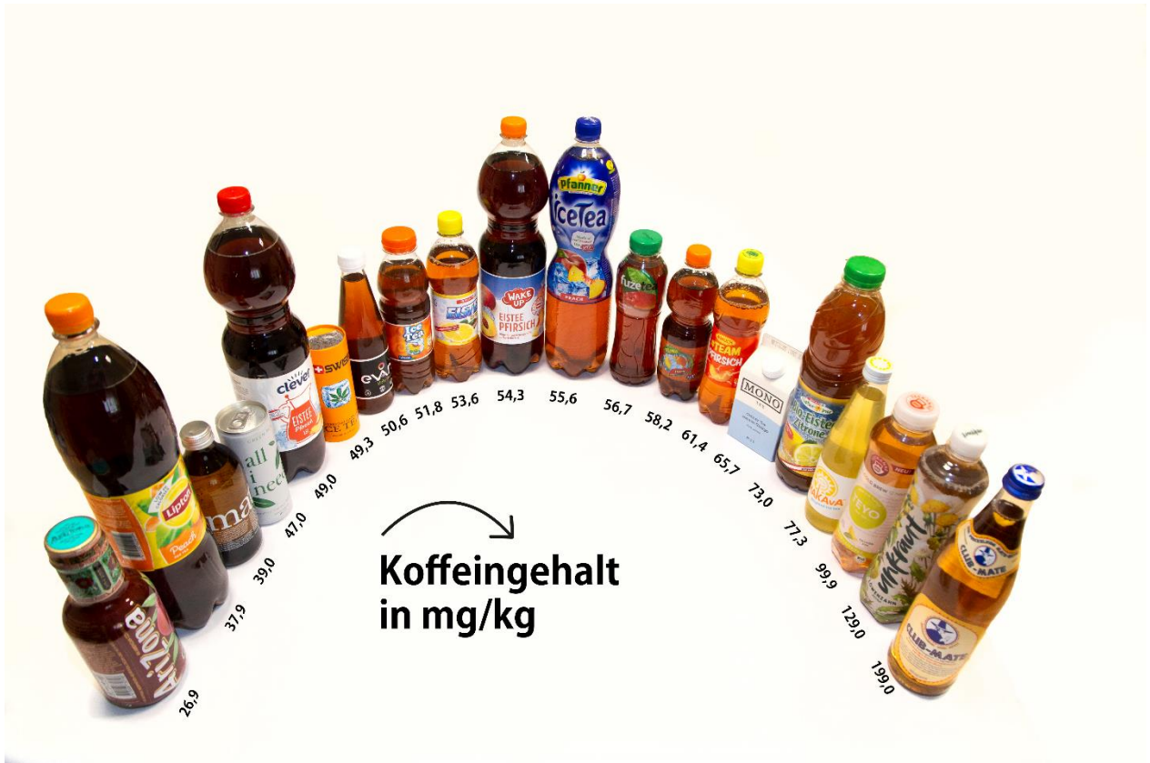
Abbildung 9: Koffeingehalt in Milligramm pro Kilogramm