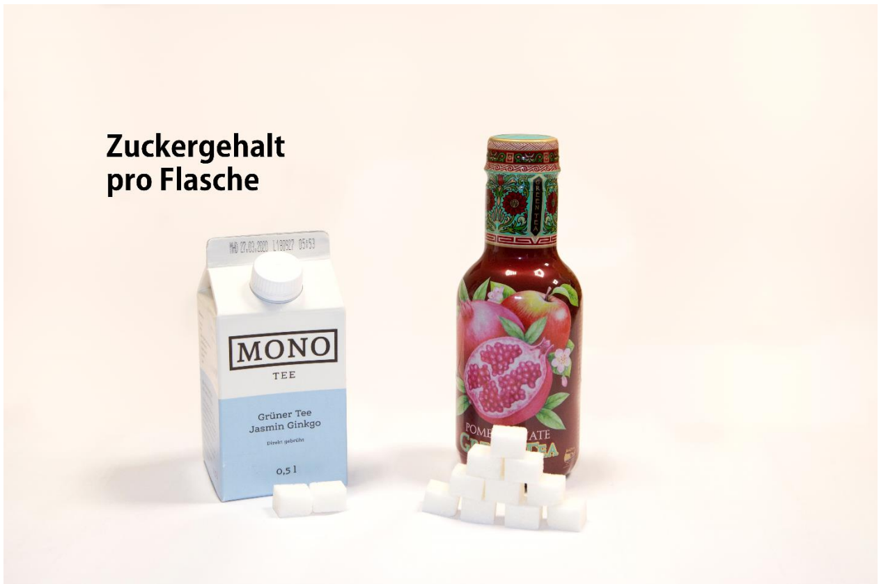
Abbildung 7: Vergleich Zuckergehalt in Gramm pro Flasche