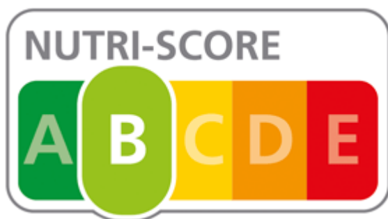
Abbildung 4: Nutri-Score 55

Geht man nach den Angaben in der Nährwerttabelle, so würden die Produkte 018 Clever und 010 Arizona mit D (orange) bewertet werden, alle anderen mit C (gelb).