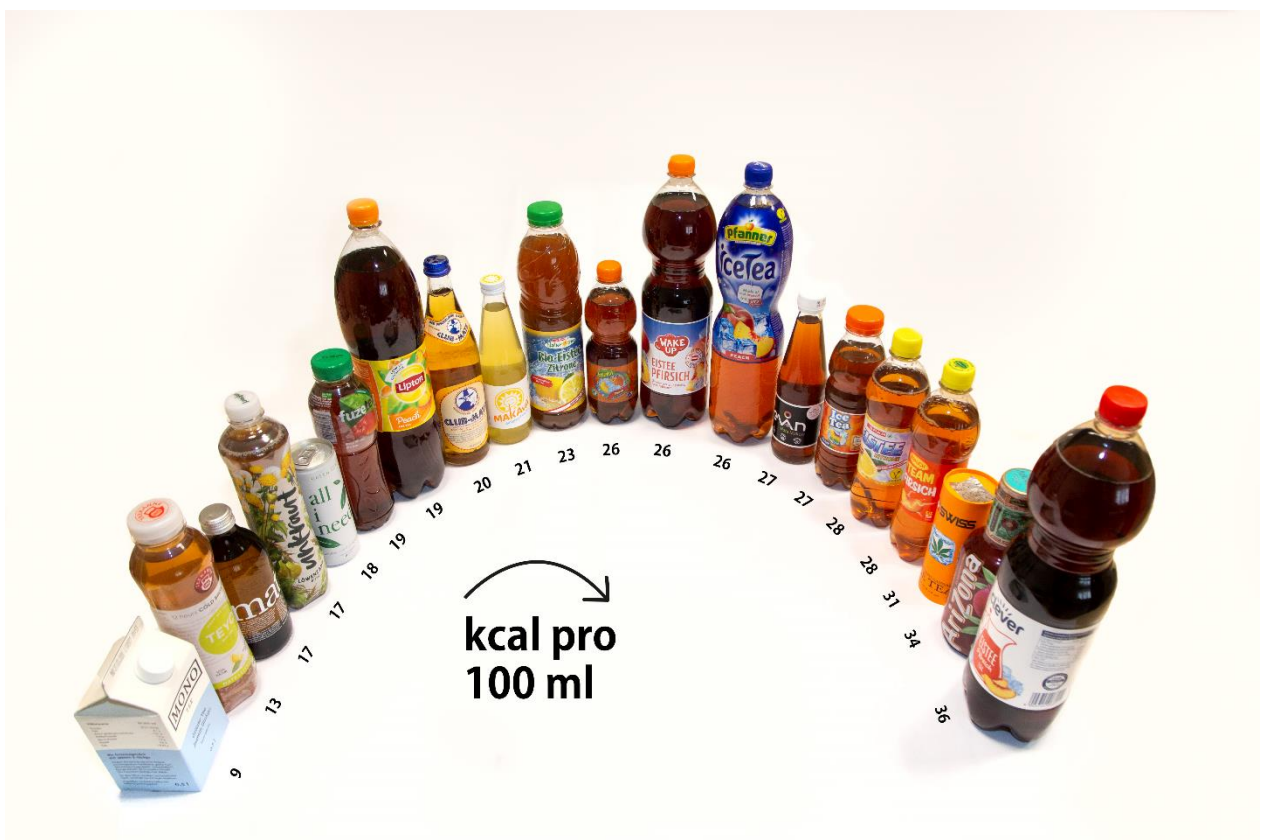
Abbildung 8: Kilokaloriengehalt pro 100 ml