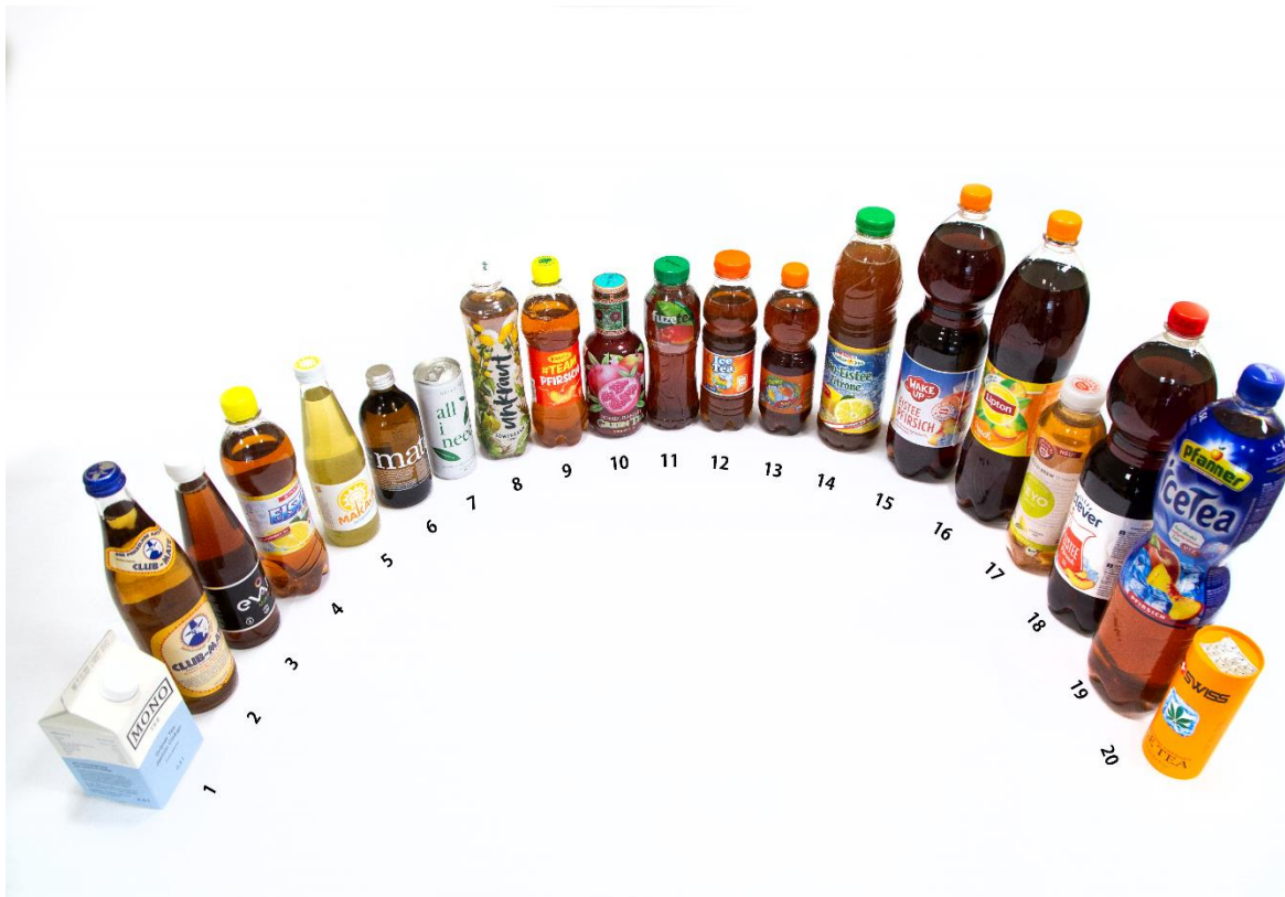
Abbildung 5: Produktnummern